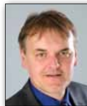
GEORG BUCHER Bürgermeister Gemeinde Bürs