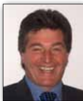
FRIDOLIN PLAICKNER Bürgermeister Gemeinde Bürserberg